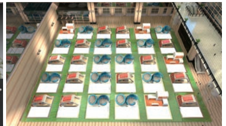
*プラットフォーム: EASY Virtual Fair 会場画像は開発中にて全てイメージ画像です。